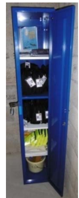
Armoire de la section Vol Moteur située dans le local de l'aéroclub du Valois

Le matériel collectif actuellement dans l'armoire CSA de l'aéroclub du Valois est composé de :