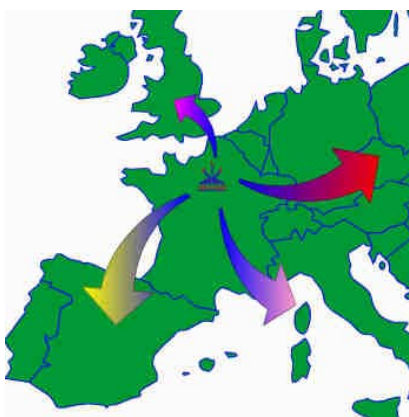
Voyages en Europe

Durant ces dernières années, les destinations les plus lointaines atteintes par des membres de la section Vol Moteur à bord d'avions d'aéroclub ont été les pays d'Europe de l'Est et de l'Afrique de l'Ouest.