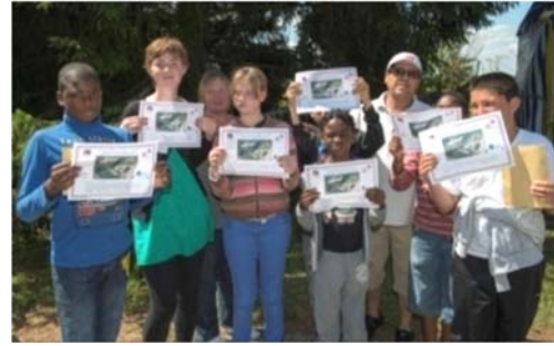
Baptêmes de l'air offerts à 80 enfants de l'hôpital Robert Debré lors de l'anniversaire des 80 ans de l'Armée de l'Air sur la base aérienne 110 de Creil

Remarque : Les conditions à réunir pour être qualifié « pilote vol découverte » sont à minima celles fixées par l'arrêté DGAC en vigueur, mais peuvent être « durcies » par le Règlement Intérieur de l'aéroclub conventionné.