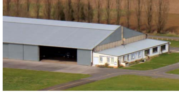
Vue générale des infrastructures de l'aéroclub du Valois installé au Plessis-Belleville

Les locaux de l'aéroclub du Valois comprennent :