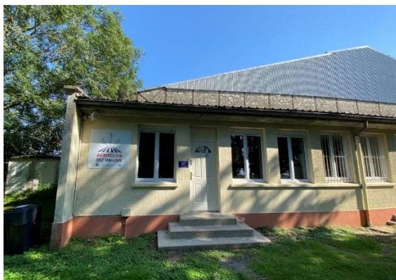
Locaux de l'aéroclub du Valois au Plessis Belleville.

Ces derniers sont rangés dans une armoire CSA mise en place au sein de l'aéroclub.