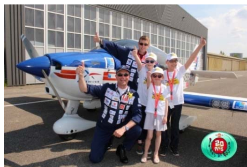
Participations d'équipages du Vol Moteur à l'opération Rêves de Gosse.