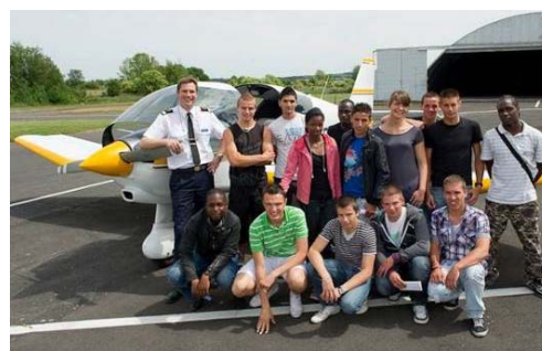
Journées baptêmes organisées par la section Vol Moteur au profit des CIRFA Air et jeunes lauréats du BIA.