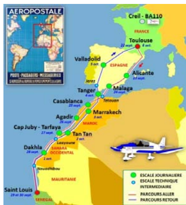
Trajet du mythique rallye « Toulouse - St Louis du Sénégal »