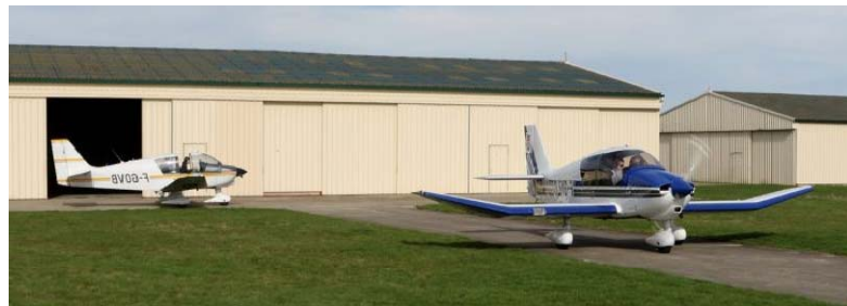
Vue intérieure et extérieure du hangar avions.