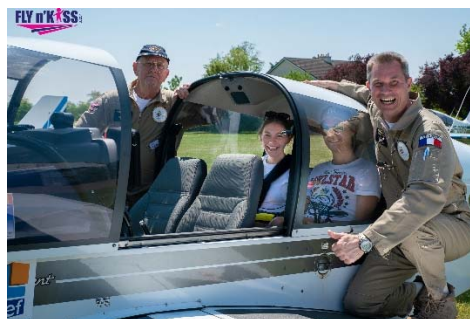
Participations d'un équipage du Vol Moteur à l'opération FLY n'KISS.