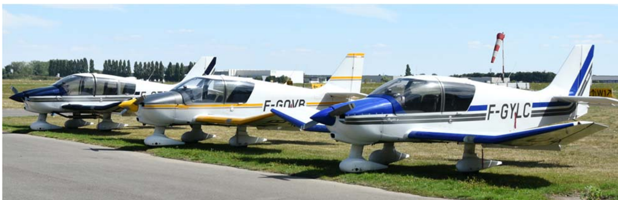
Vue des avions type DR400 de l'aéroclub du Valois