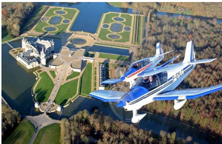
Vol en patrouille au-dessus du château de Chantilly

Pour compléter son offre actuelle, l'aéroclub proposera prochainement la réalisation du BIA (Brevet d'Initiation Aéronautique), en partenariat avec des établissements de l'Education Nationale de l'Oise et d'Île-de-France.