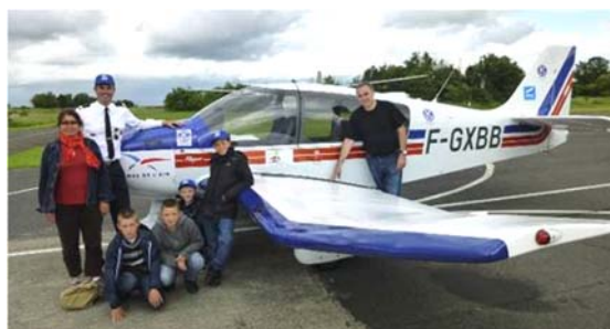
Journée de baptêmes de l'air du KIWANIS.